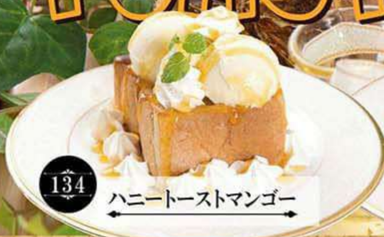
134 ハニートーストマンゴー