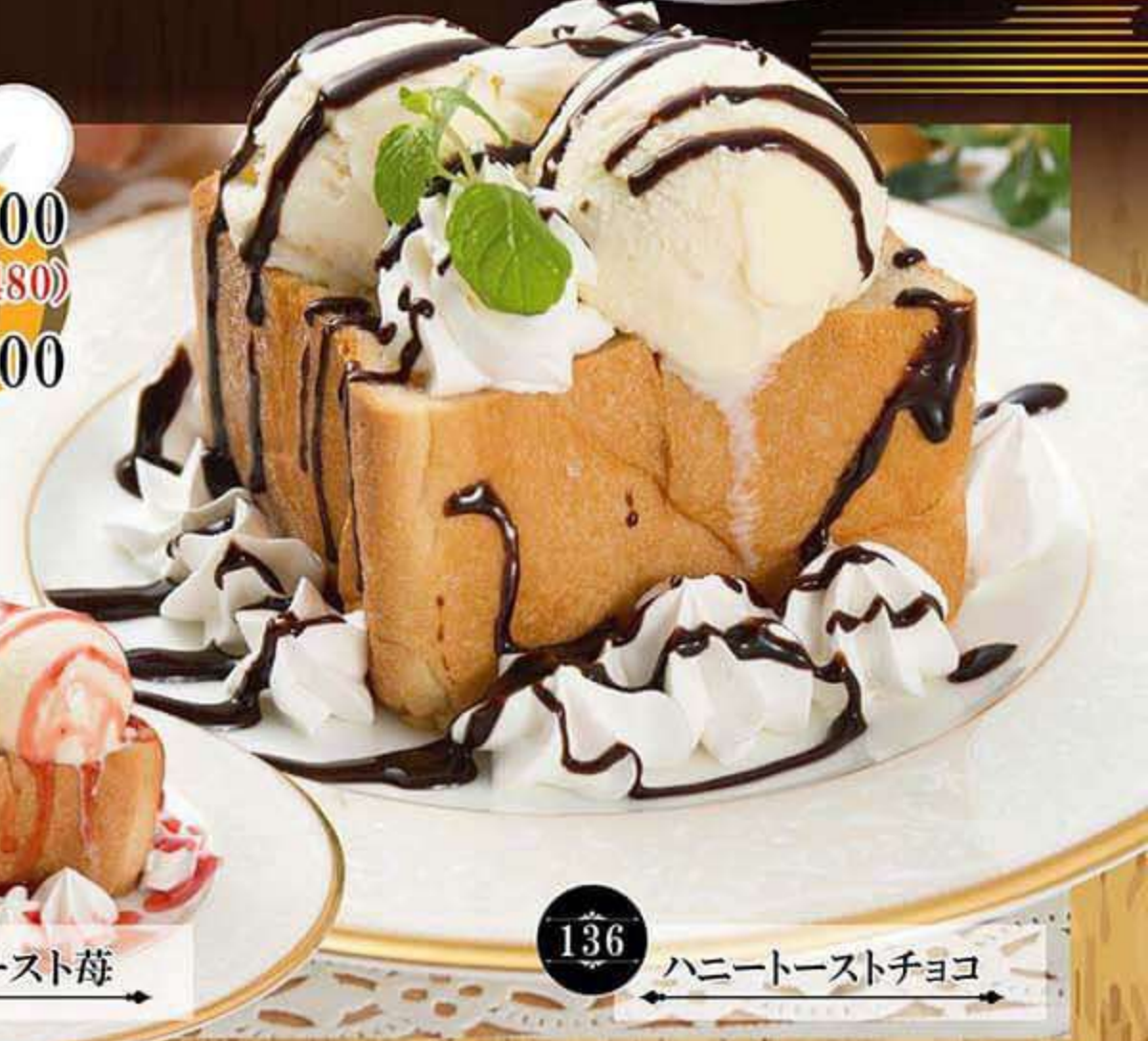
136 ハニートーストチョコ