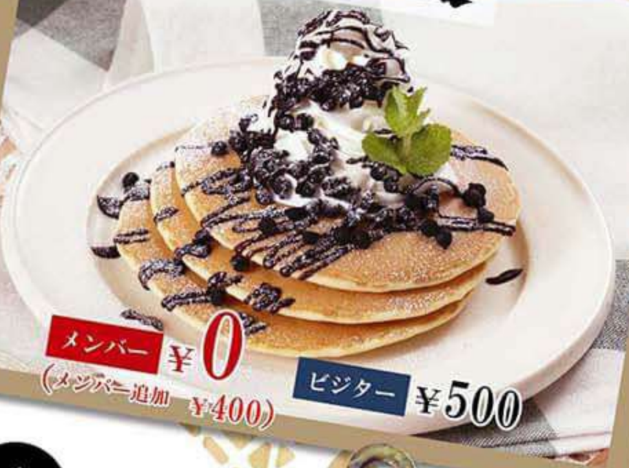
パンケーキ チョコレート