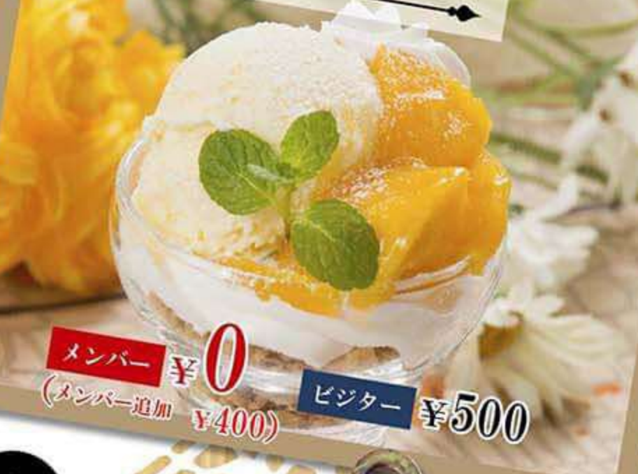
ミニパフェ マンゴー