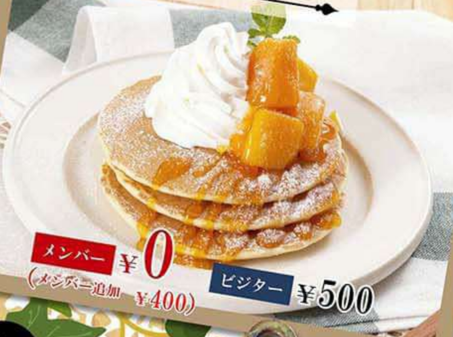
パンケーキ マンゴー