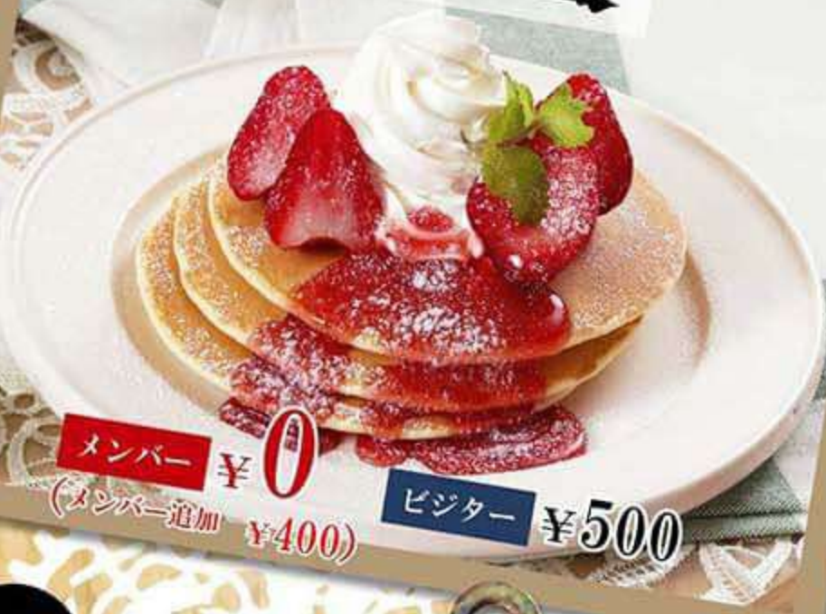
パンケーキ ストロベリー