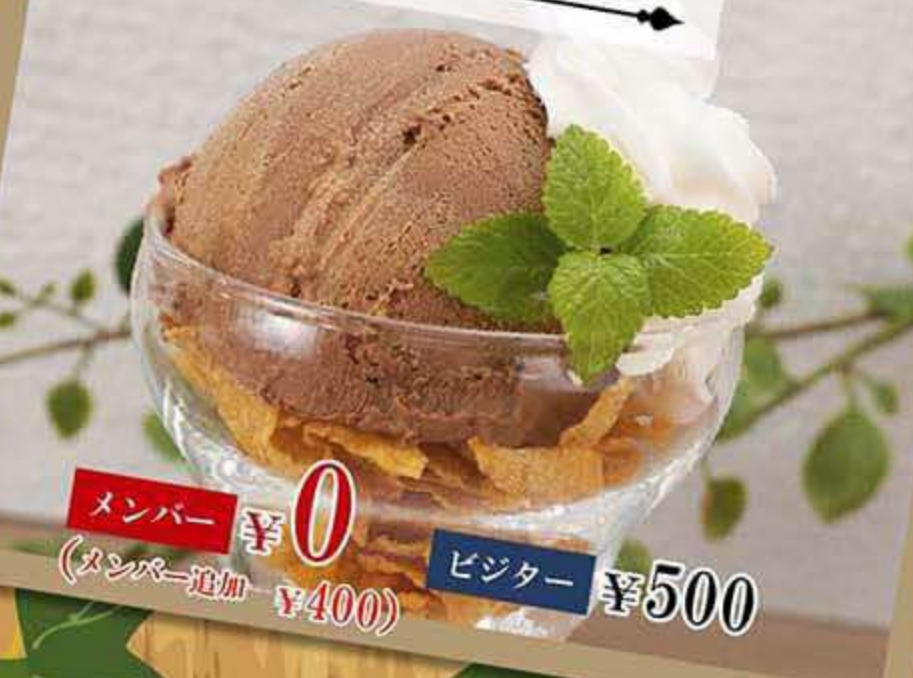
ミニパフェ チョコレート