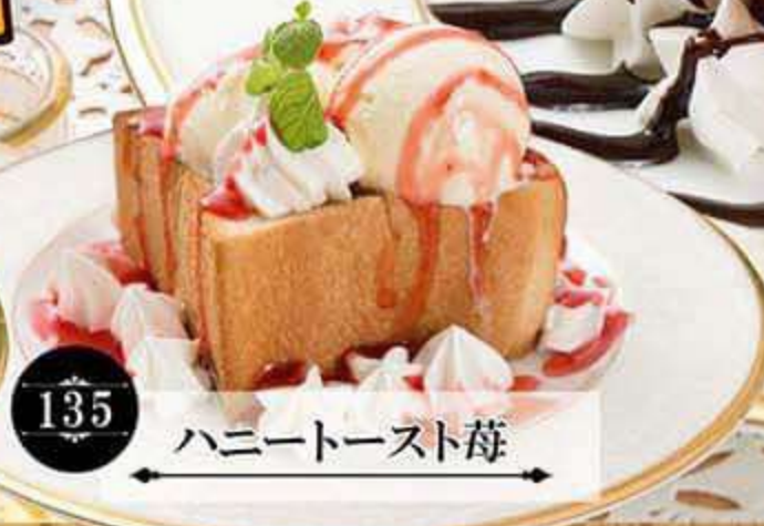
135 ハニートースト苺