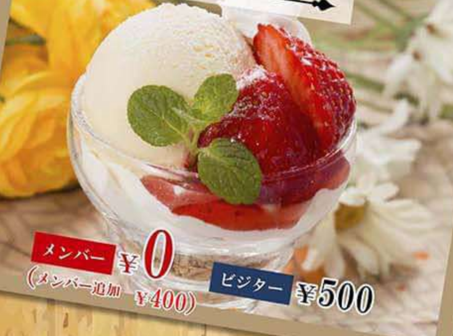
ミニパフェ ストロベリー